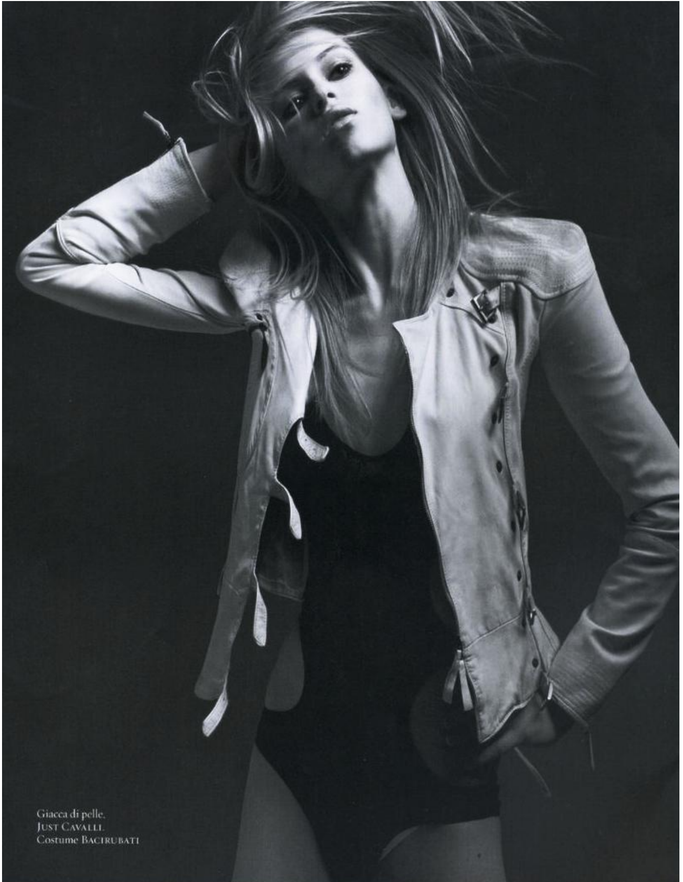
Giacca di pelle. JUST CAVALLI Costume BACIRUBATI